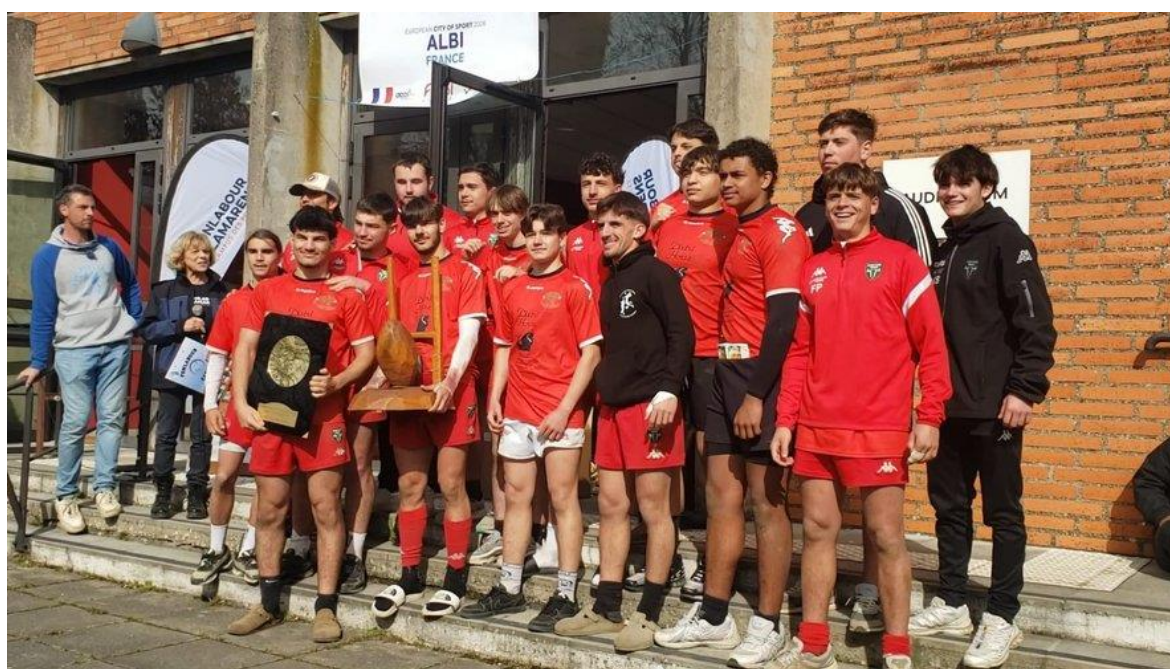
Rugby : l'Agrocampus est champion de France des lycées agricole 2026

Classes 2 nde 1 ère et Terminale 2026 - 2027