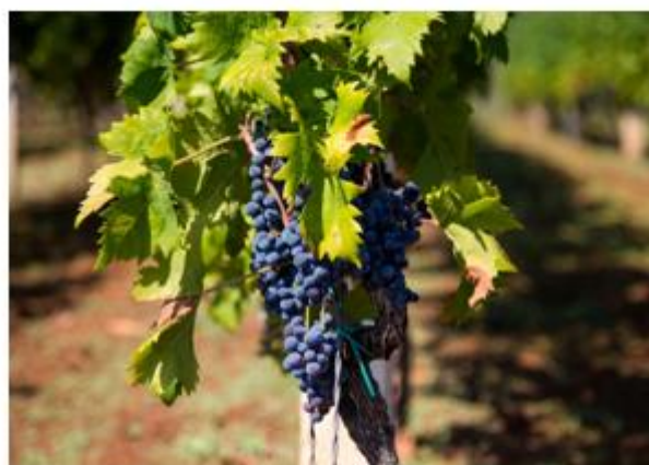
Viticulture, Œnologie & Production Agricole