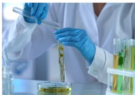
Enseignement Général et Technologique (Scientifique – Agronomique – Vivant)

Intégration possible hors de ces créneaux en cas d'incompatibilité D'autres journées peuvent être proposées en fonction des activités pédagogiques des classes