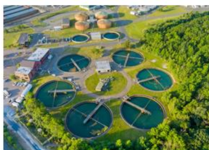
Eau & Environnement