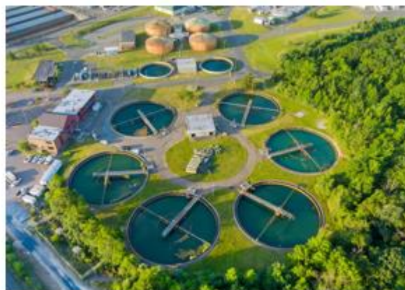
Eau & Environnement