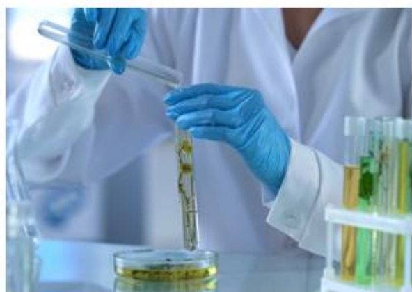
Enseignement Général et Technologique (Scientifique – Agronomique – Vivant)